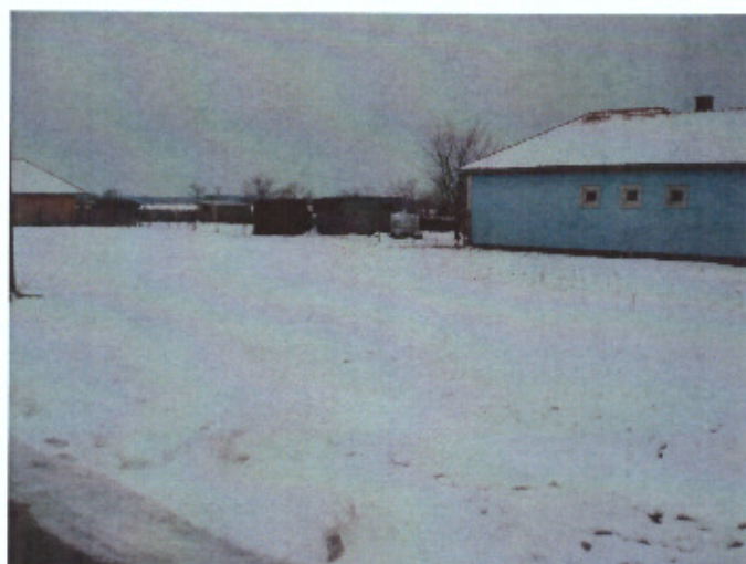
Sport utca felől(jobbra)