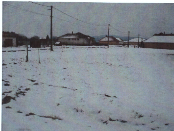
Nyírfa utca felől(jobbra)