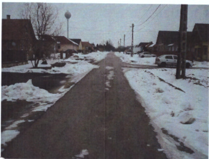
Nyírfa utca felől(jobbra)