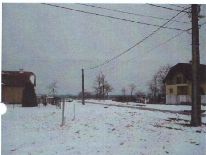
Sport utca felől(balr)